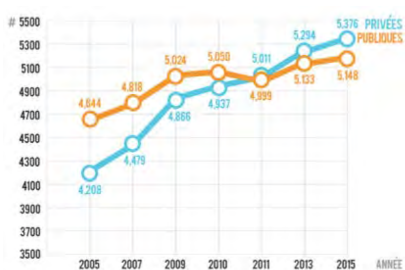
Figure 1. Croissance du nombre de fondations au Canada (2005-2015) 1

Depuis les années 1980, à l'échelle internationale, plusieurs travaux rapportent l'arrivée plus ou moins récente d'un vaste éventail de stratégies philanthropiques se réclamant d'un renouvellement des pratiques (philanthrocapitalisme, venture philanthropy , philanthropie catalytique, etc.). Arrimée à une reconfiguration néolibérale de l'État social, l'augmentation de l'action philanthropique s'est aussi observée au Canada et au Québec. Au Canada, cela se traduit notamment par l'augmentation d'environ 25% en dix ans de fondations au pays, passant de 4 208 en 2005 à 5 375 en 2015, une croissance qui semble se maintenir d'année en année.